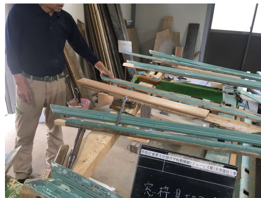
【内装用既存木材修理】