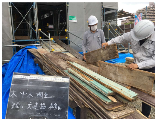
【内装用既存木材調査】