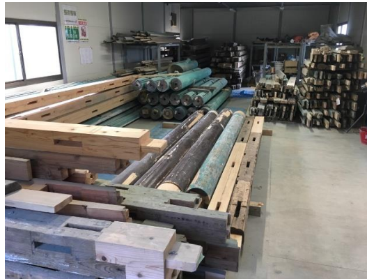
【修理済木材保管状況】