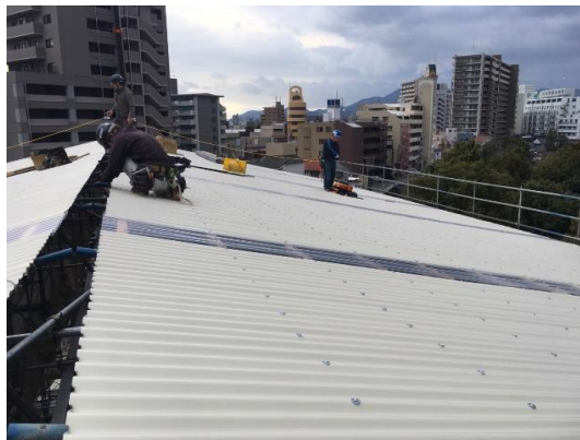
【外部足場(素屋根足場) 架設工事①】

県指定重要文化財洋学校教師館(ジェーンズ邸) 災害復旧工事 進捗状況 2月28日現在