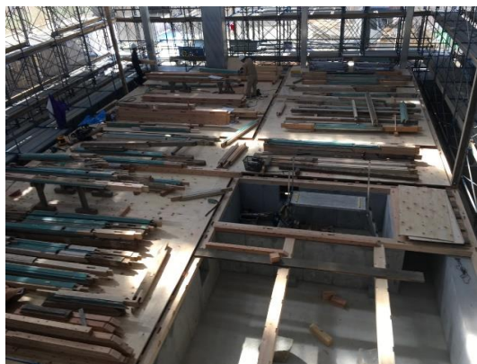
【床組及び建て方準備】