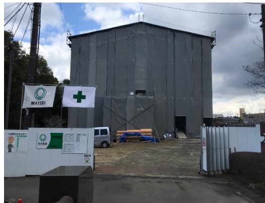
【外部足場(素屋根足場) 架設②】