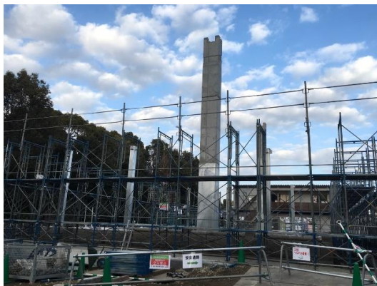
【外部足場架設工事①】

県指定重要文化財洋学校教師館(ジェーンズ邸) 災害復旧工事 進捗状況 1月31日現在