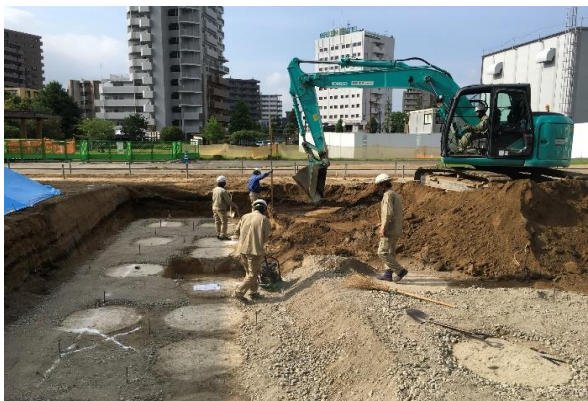
【移転先 基礎部掘削①】

県指定重要文化財洋学校教師館(ジェーンズ邸)災害復旧工事 進捗状況 6月30日現在