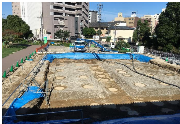
【移転先 基礎部掘削②】