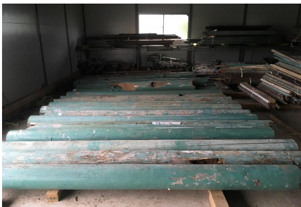
【既存材保管場所 木材調査①】