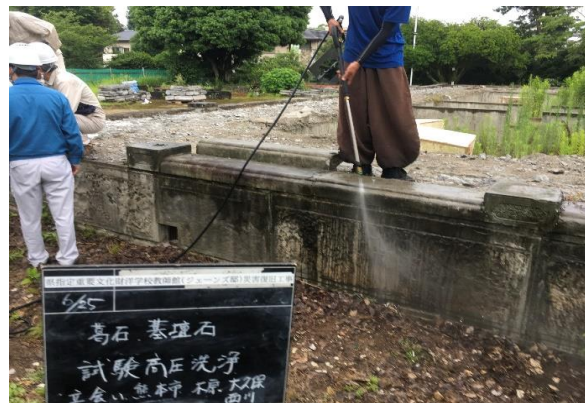
【移転元 基壇石洗浄】